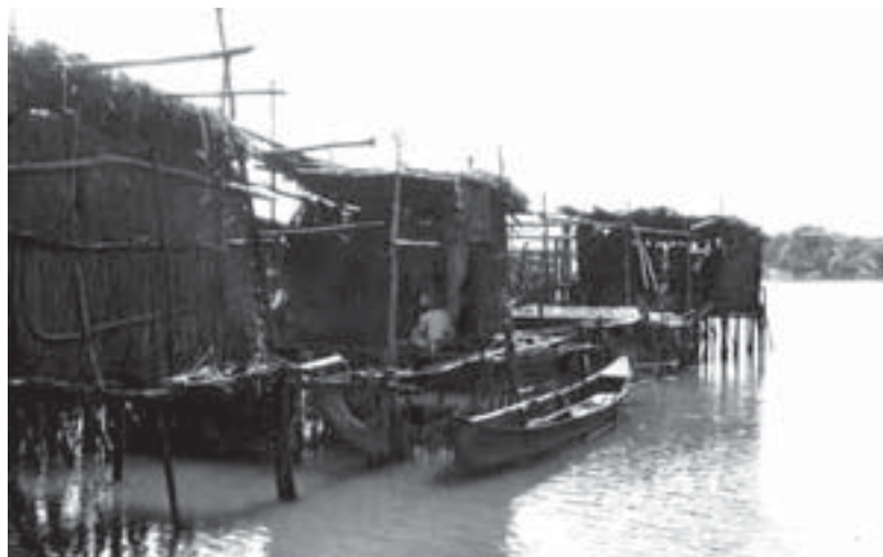
Erich Andres: Fischerdorf bei Shkodra 1931