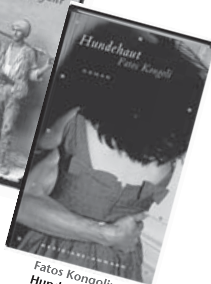
Fatos Kongoli: Hundehaut Roman - 300 S.