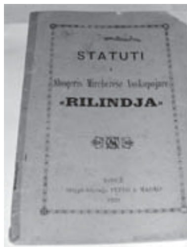
Originalsatzung der Gesellschaft aus dem Jahr 1929