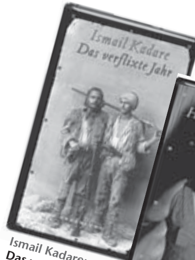
Ismail Kadare: Das verflixte Jahr Roman - 192 S.