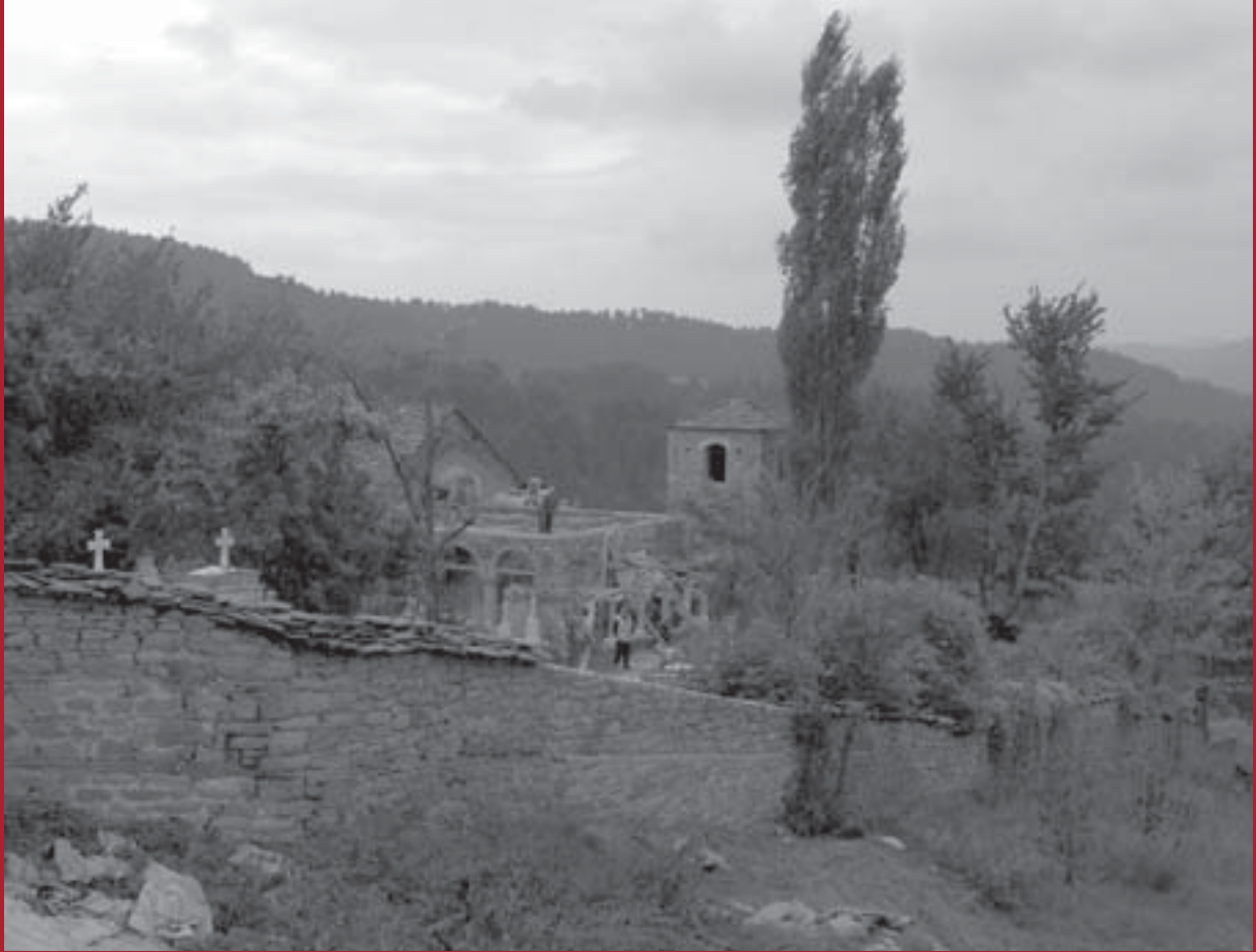
Shipckë: Restaurierungsarbeiten an der Kirche Shën Gjergj