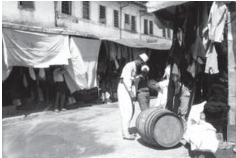
Erich Andres: Altstadt von Shkodra 1931